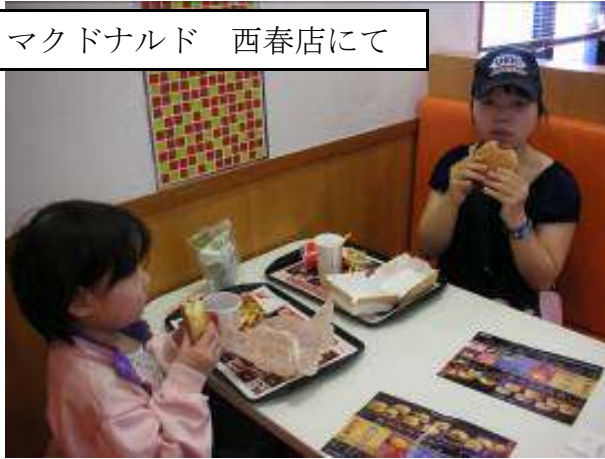
マクドナルド 西春店にて